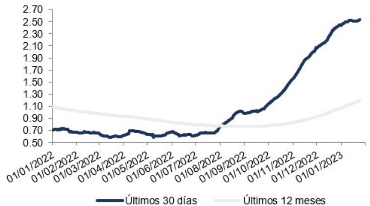
Evolución Rendimientos Liquidez Dólares