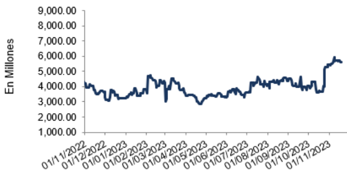
Evolución ultimo año, Activo Neto Liquidez Colones