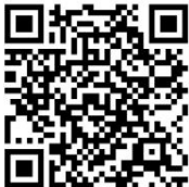
Código de Timbre: CPA-1000-9761