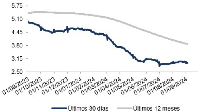
Evolución Rendimientos Liquidez Colones